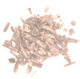
Bahan setelah Dibakar